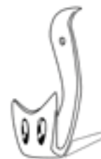
Les Fou braqués